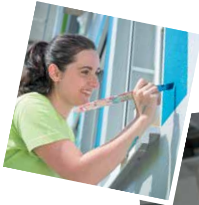
Unterschiedliche Techniken wurden simuliert und teilweise sogar vor Ort ausgeführt.