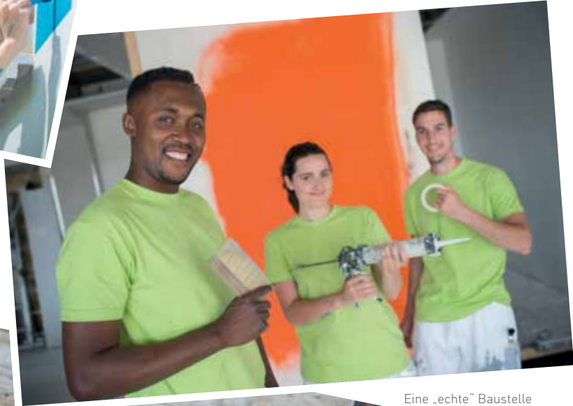
Eine „echte“ Baustelle in Dortmund diente als Shootinglocation für die Arbeitsaufnahmen.