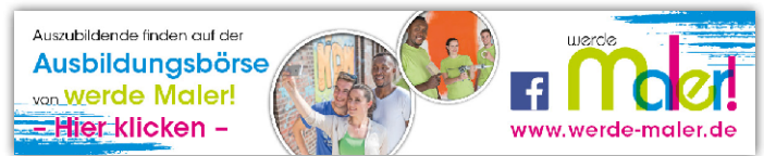
Onlinebanner - Motiv: „Ausbildungsbörse“