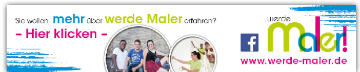
Onlinebanner - Motiv: „werde Maler 2“