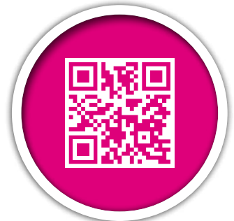
QR-Code: klassisch und in werde Maler-Optik

Sie können alle Materialien unter folgendem Link herunterladen oder über das Bestellformular (siehe Folgeseite) bei uns als Datenpaket per E-Mail bestellen.