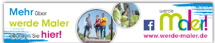
Onlinebanner - Motiv: „werde Maler 1“